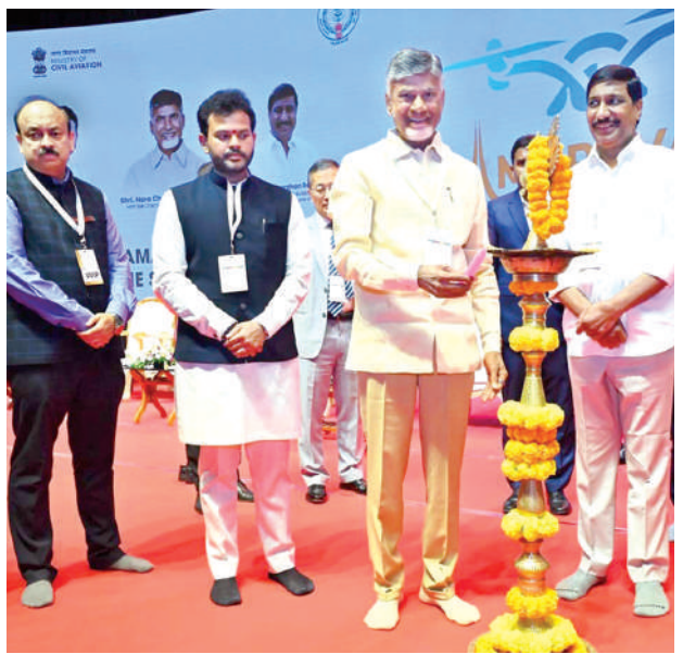
మంగళవారం జ్యోతి ప్రజ్వలనతో డ్రోన్ సమ్మిట్ను ప్రారంభిస్తూ, సిఎం చంద్రబాబు