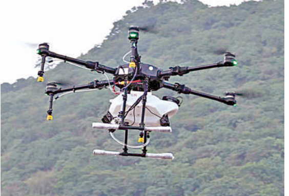
సమ్మిట్ ప్రారంభం సందర్భంగా సిఎం చంద్రబాబు ఆవిష్కరించిన డ్రోన్